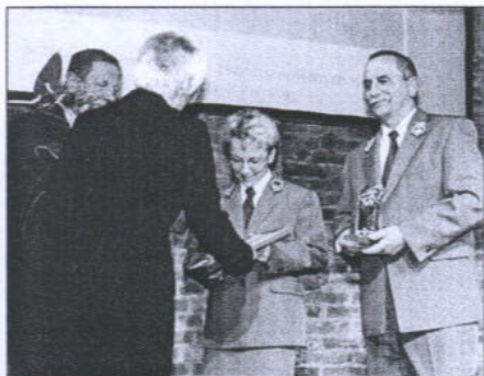
Nagrodę odbiera delegacja Nadleśnictwa Kaliska. Na zdjęciu obok – zdobyte trofea