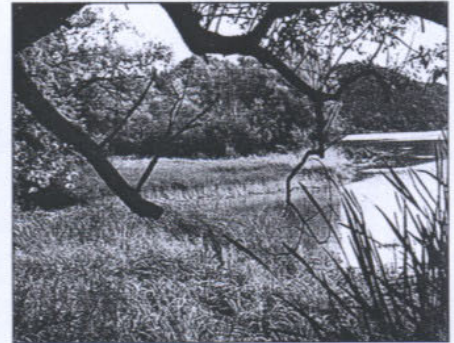
Zrekultywowany przez Hydroprojekt brzeg zbiornika różnowskiego